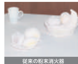
従来の粉末消火器

従来の粉末消火器は、部屋中に粉が飛散しますが、キッチンアイは薬剤を拭き取るだけで、後片付けが簡単です。